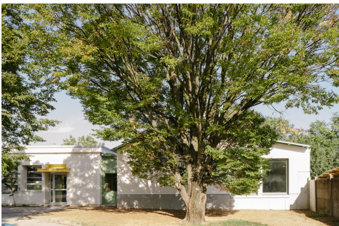
Extension de l'école maternelle Saint-Exupéry, Villeurbanne

Architectes HMONP - commune atelier d'architecture - Lyon (69)